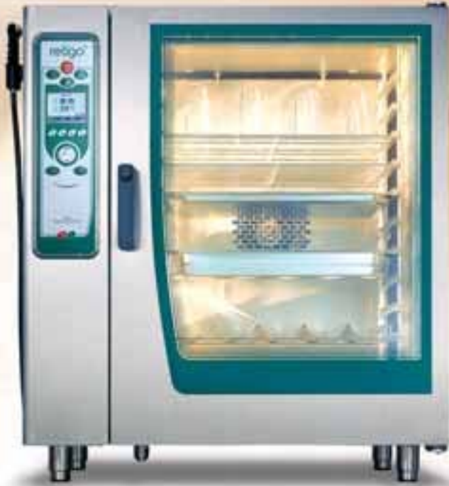
RETIGO DIGITAL 10 x GN1/1