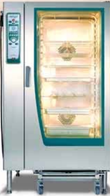
RETIGO DIGITAL 20 x GN1/1